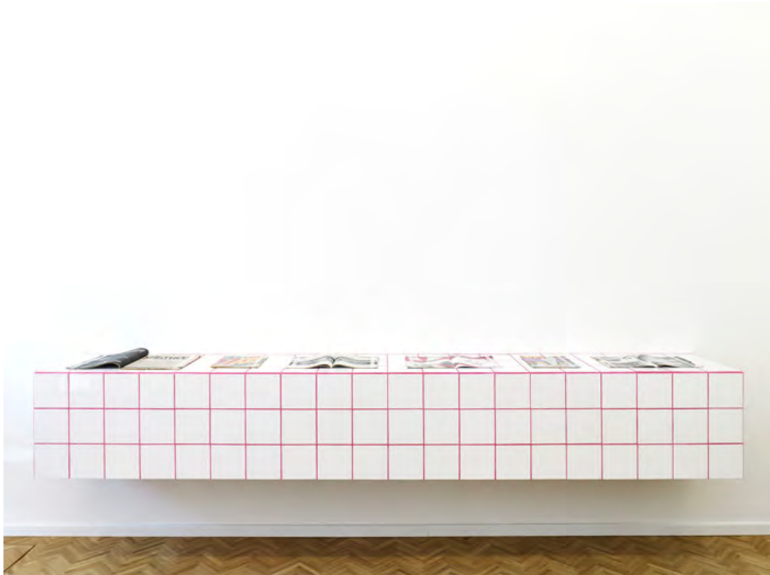
Installation view of WET, The Magazine of Gourmet Bathing, 1976-81